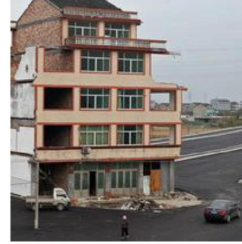
这是浙江温岭强拆钉子户。

拆迁工作人员深知补偿不能变动，变动就价值元零，而补偿的征收人也是完全理解这一点，但部分被拆迁人就愿意坚持，非得强拆，我只要提高1%。一般日法这样坚持，拆迁工作人员只能苦笑着一道又一遍的解释，公共知识分子，不需要这样去解释。