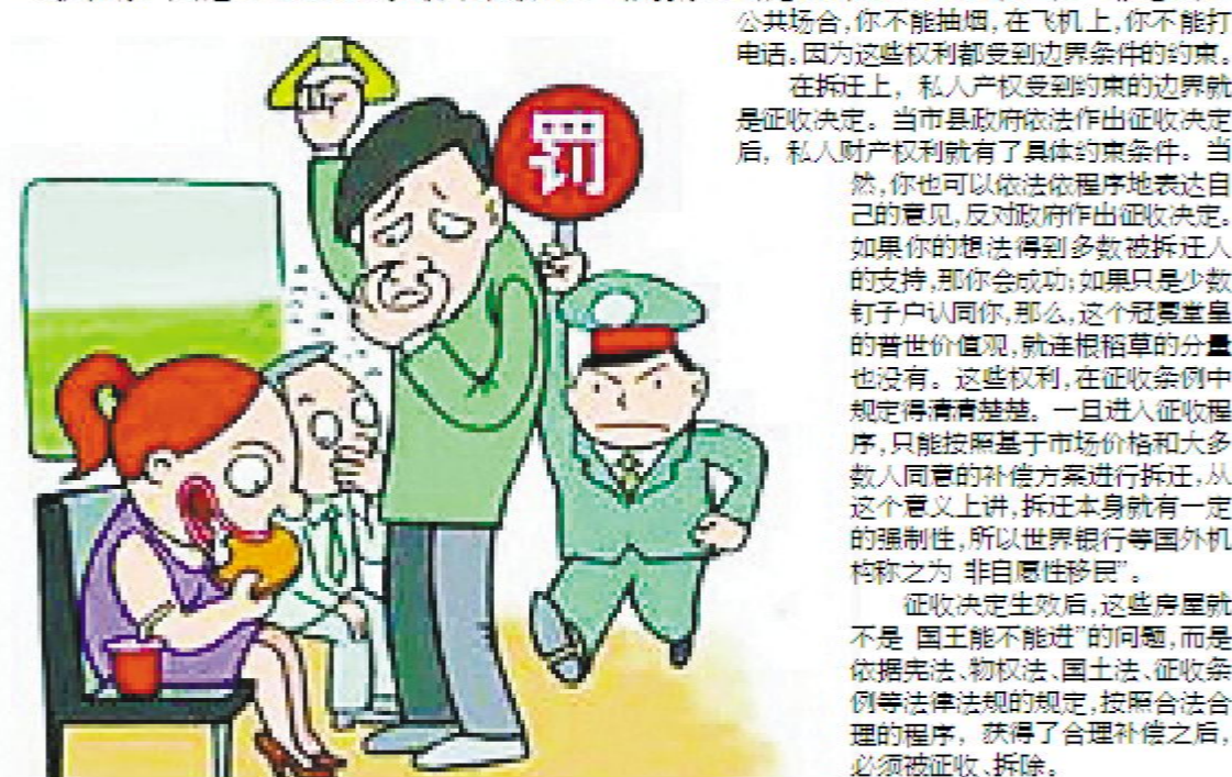
吃饭是你的权利，但在饭快吃时，就要受到处罚。

这句话在人们谈论拆迁时被引用了，但其实是牛头不对马嘴。风能进、雨能进，国王不能进，其实是房屋所有权与房屋使用权两个事情。有人也许说，你到牛头角尖，我说的是私有财产神圣不可侵犯，这可是普世价值观。保护私有产权，这个毫无异议。宪法、物权法和其