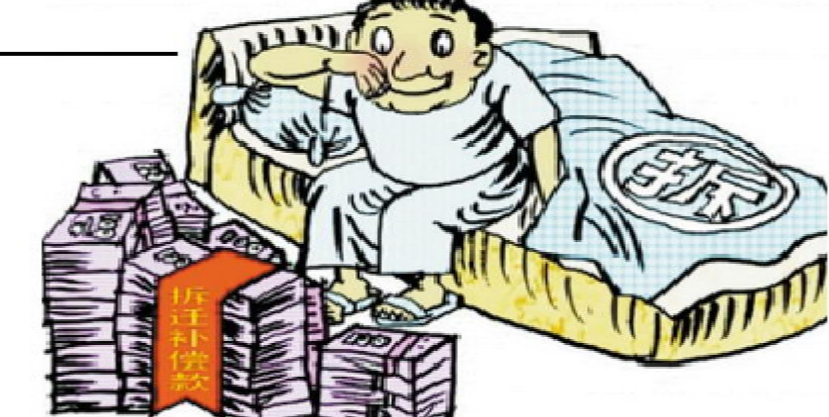
拆迁一波三折的钉子户不少，2013年9月，人民时评，如何破解拆迁暴富之谜？