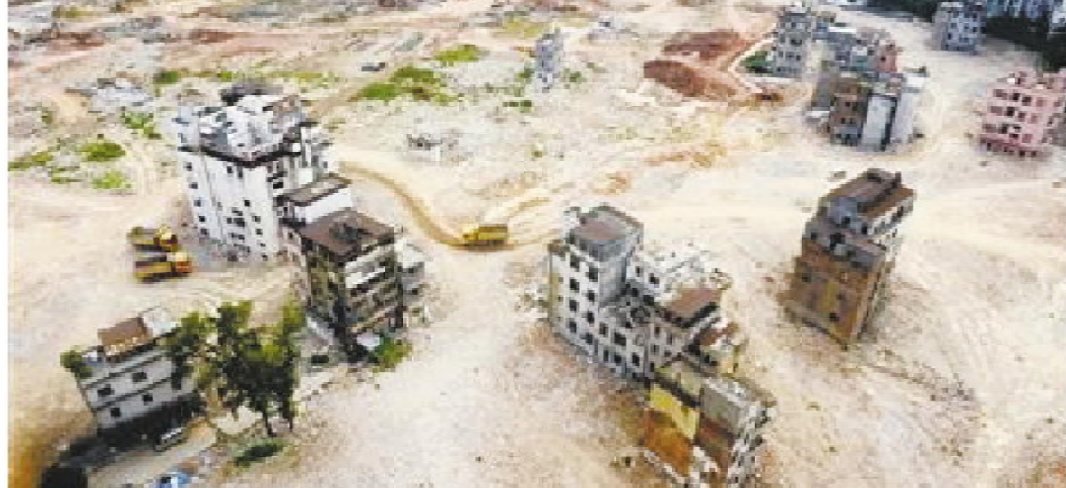
这是广州番禺桥南村18户钉子户的分布图，强拆也没办法在此新建项目。

有新闻电视台报道广州拆迁项目，涉及了强拆拆迁问题。可能是拆迁人员向电视台说明：根据规划，需要拆迁钉子户，于是电视台作了这样的评价：规划不合理，为什么先进行规划设计？为什么不等等？为什么先进行规划设计？为什么不等等？为什么先进行规划设计？为什么不等等？