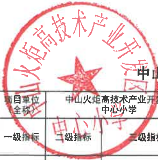
中山市火炬开发区2022年度财政支出项目绩效核查评分意见表