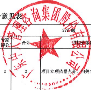
中山火炬开发区2023年度财政支出项目绩效核查评分意见表