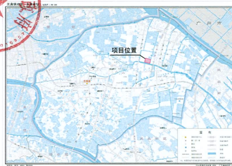
修正地块在三角镇的位置