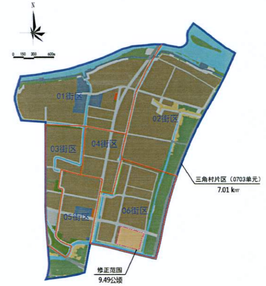
修正地块在三角村片区（0703单元）的位置