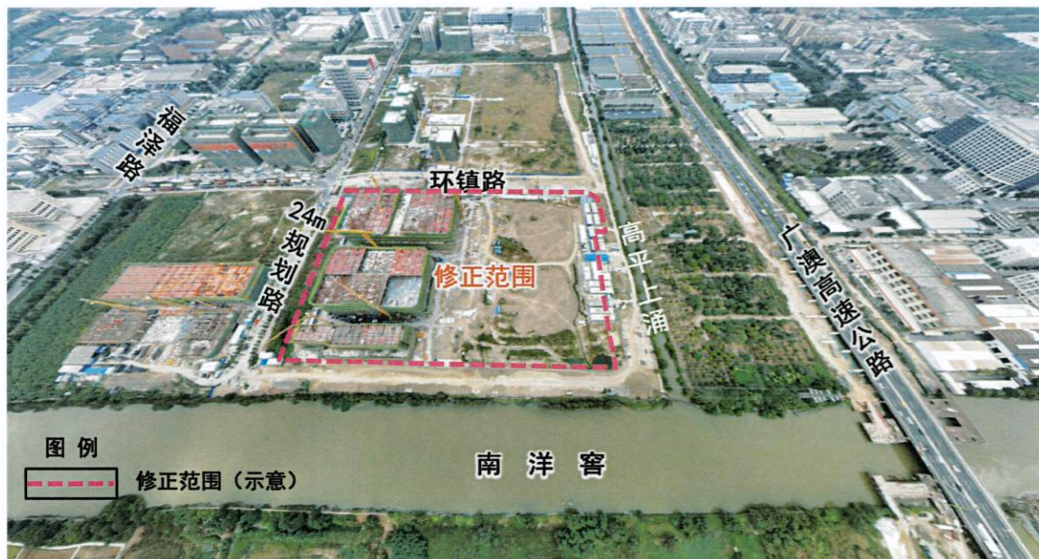
修正地块现状概况

本次技术修正地块位于三角村片区（0703单元）06街区的南部，地块北接环镇路，东接15米规划路，临近高平上涌，南接15米规划路，临近南洋窖，用地面积约为9.49公顷。